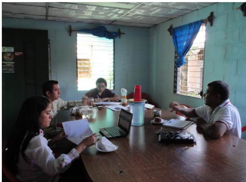
Alcalde y Concejal de la Alcaldía de Tecoluca en Taller de Evaluación del Proyecto.