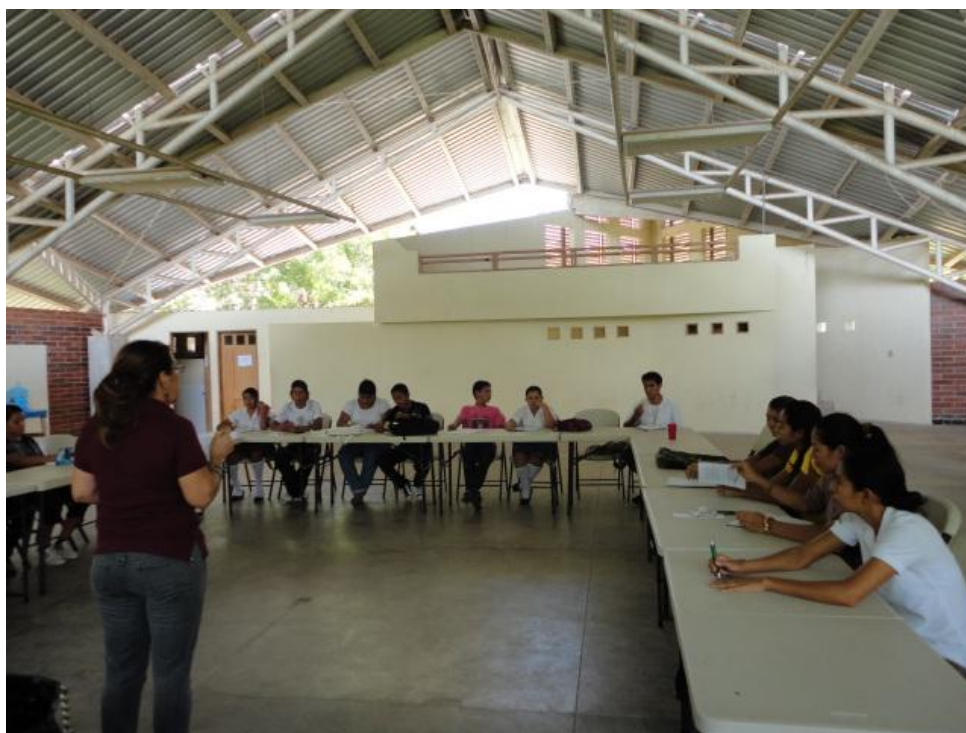
Jóvenes asistentes al taller de evaluación del proyecto