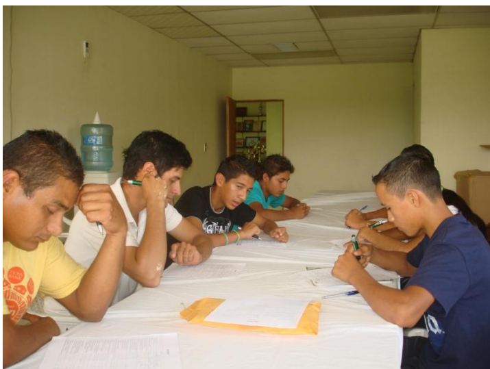
Grupo de Trabajo durante la evaluación del proyecto

La evaluación se realizó tomando en cuenta la pertinencia de los objetivos y su grado de realización, la eficiencia en cuanto al desarrollo, la eficacia, el impacto (efectos positivos y negativos esperados y no esperados) y la viabilidad (estimación de la capacidad de continuación de las acciones de manera autónoma).